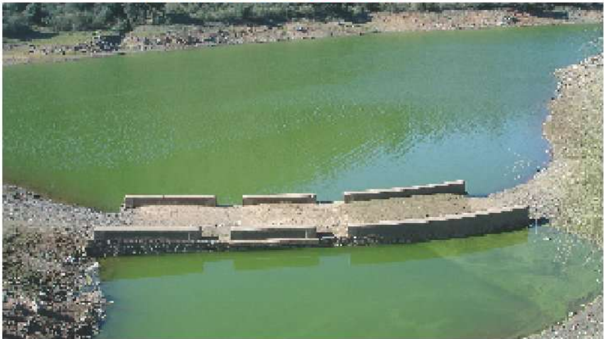
Camino que sobresale de la lámina de agua. / Trail that excels of the water.

DESCRIPCIÓN: La primera parte del trayecto de esta ruta es común con el trayecto inicial de la ruta 17 que llevaba a la Casa del Retiro desde El Ronquillo. El tramo común coincide con los cuatro primeros kilómetros que discurren prácticamente en paralelo al cauce del Arroyo del Niño o del Hoyo, y que acaban en la orilla de la cola del embalse de La Minilla. Mientras aquella ruta seguía hacia el sur, aguas abajo en dirección a la zona del embalse, hasta encontrarse en las cercanías de la Casa del Retiro, en esta ruta seguiremos otros cuatro kilómetros en dirección al norte, remontando las aguas de la cola del embalse. Es ésta por tanto una ruta de ocho kilómetros de ida y otros tantos de vuelta.