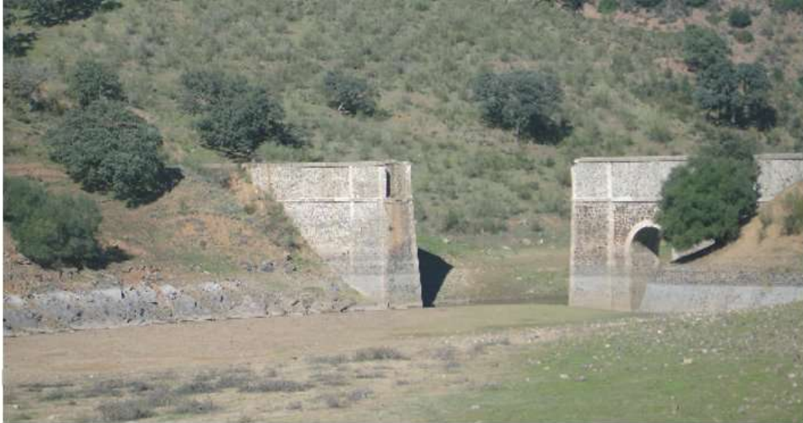
Puente cortado y final del trayecto de la Minilla. / Ruined bridge and end of the journey of La Minilla.